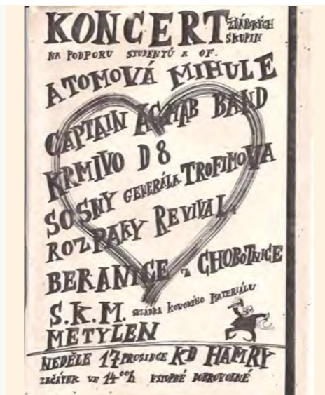
Koncert na podporu studentů a OF 1989